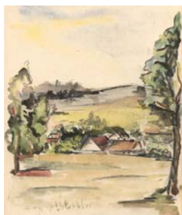
Kresba z kroniky MNV Všeštar