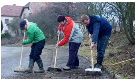
Společná práce vede nejen ke zvelebení obce, ale pomáhá ke vzájemnému poznání, výměně názorů a pochopení.

Tak snad se začne časem blýskat na lepší časy, i ostatním přestane být lhotečné, jak Vsestary vypadají a pochopí, že účastí na společných dnech pro obec pomáhají především sami sobě.