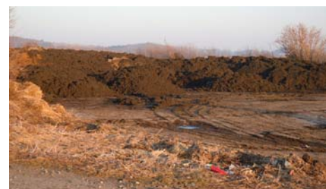
Nebezpečné kaly na nefunkčním hnojšti.

Hnojště má v užívání firma ZEA Světice, navážení pravděpodobně provádí jiná firma, která se zabývá likvidací tohoto odpadu. Vše funguje asi takto: firma vyinkasuje nemalé peníze za likvidaci odpadu, poměrnou část z této sumy přenechá firmě ZEA a